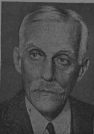
Mr. ANDREW MELLON

Ex-Ministro de Finanzas de los Estados Unidos. Fue acusado por la actual Administración de complicidad en diversos escándalos financieros. Bajo la presidencia de Herbert Hoover fué uno de sus principales colaboradores y orientador de la política comercial e industrial de aquél.